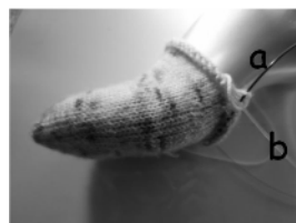
Sur cette chaussette, le haut du pied est sur un cable, le bas (la semelle) sur l'autre