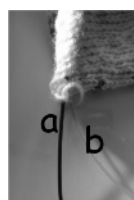
Ici, les deux cables (a et b)

Pour un ouvrage tricoté en circulaire, qu'il soit de petite (chaussettes) ou de grande (pull) circonférence, il est possible (et même plus simple) de tricoter avec DEUX circulaires, chacune portant la moitié approximative du cercle. C'est la solution idéale pour des doigts de gants, par exemple.