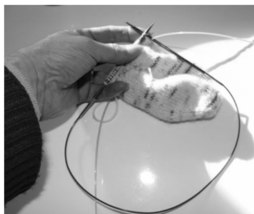
On tricote sur le même ensemble cable+pointe, l'autre étant en attente.